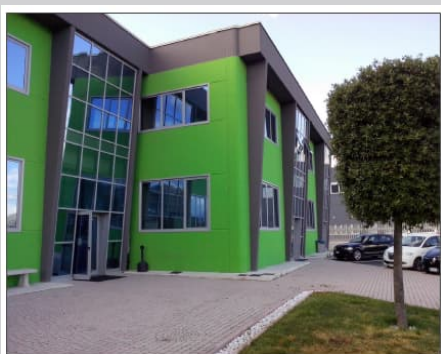
LA MANUTENZIONE INDUSTRIALE AL SERVIZIO DEI NOSTRI CLIENTI

Offrire un servizio di manutenzione meccanica industriale a 360° in grado di soddisfare i propri clienti per fidelizzarli e creare business reciprocamente.